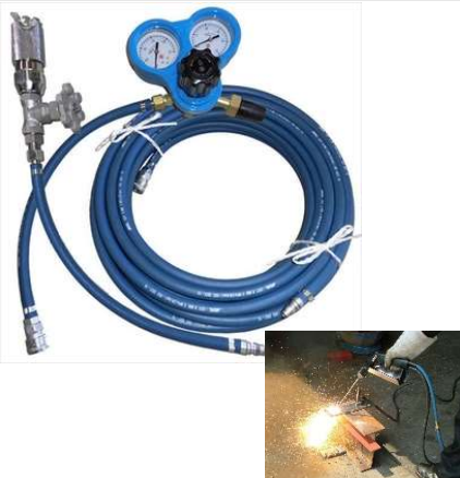
シャープランス/スターカッテンド