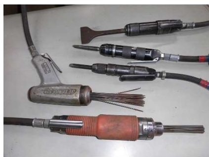
ジェットタガネ/フラックスハンマー