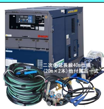
二次側延長線40m仕様 (20m×2本) 他付属品一式