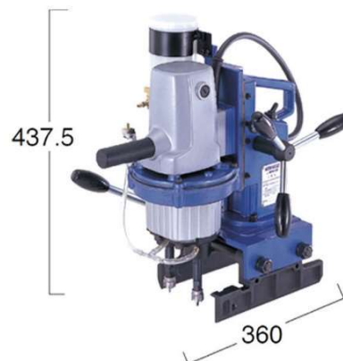
磁気ボール盤(ミニアトラW軸)