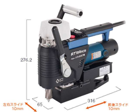
磁気ボール盤(低床型)