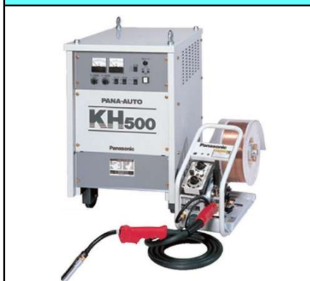
ガウジング兼用半自動溶接機