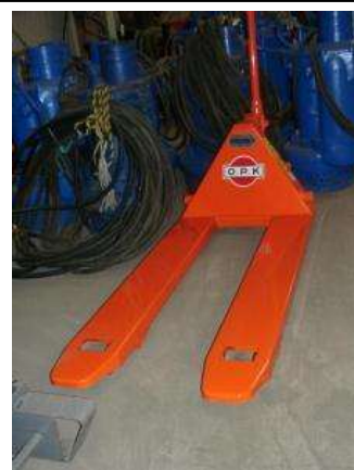
キャッチパレット